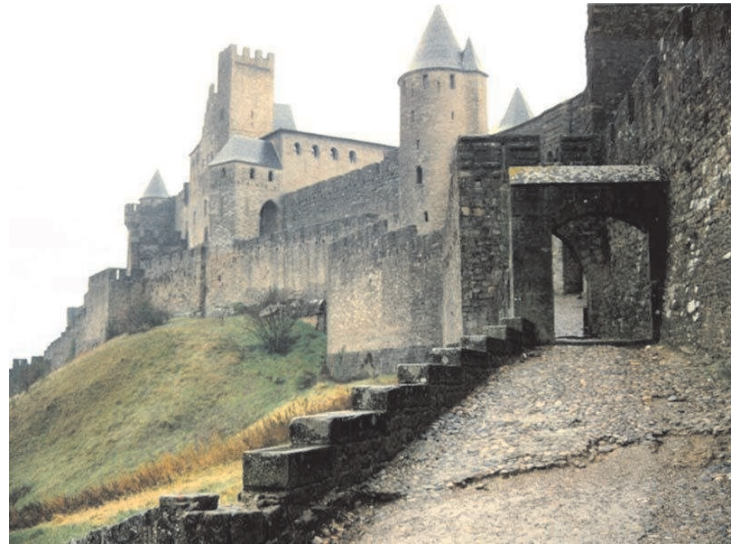
le château de Carcassonne

Les fossés au pied des remparts étaient comblés en