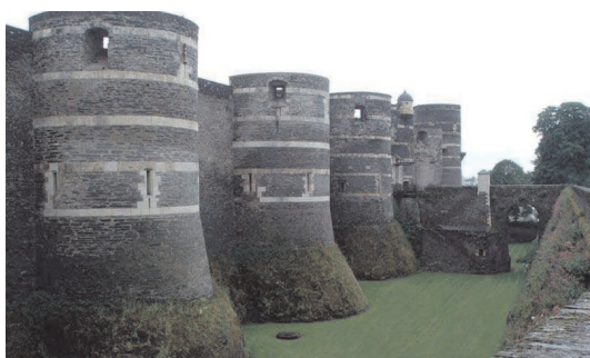
Voici le château d'Angers

Etabli sur un site gallo-romain et autour de l'habitation des premiers comtes d'Anjou, le château d'Angers est un exemple remarquable de l'architecture défensive du Moyen Âge. La forteresse fut bâtie par Saint-Louis en 1230. Puisant de ses 17 tours, le château présente une silhouette étonnante avec ses fameuses tours construites en alternance de schiste et de tuffeau.